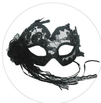
Pie de foto: Antifaces de puntilla