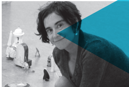
NEREA DE DIEGO BILDUMAREN ESZENARATZEA PUESTA EN ESCENA DE LA COLECCIÓN ELIZBARRUTIKO MUSEOA / MUSEO DIOCESANO