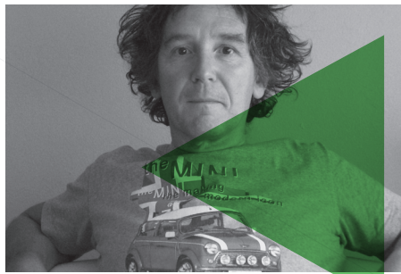
IÑIGO SALABERRIA KAIA EL MUELLE UNTZI MUSEOA / MUSEO NAVAL