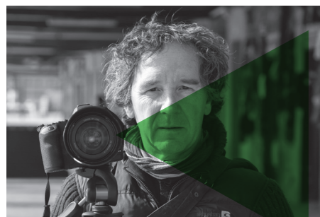
IÑIGO SALABERRIA KAIA EL MUELLE UNTZI MUSEOA / MUSEO NAVAL