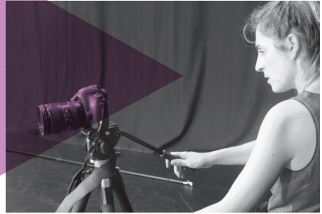
ZUHAR IRURETAGOIENA ABSENTIA. (TRIANGULU GORRIA, LERRO URDINA) ABSENTIA. (TRIÁNGULO ROJO, LÍNEA AZUL) SAN TELMO MUSEOA / MUSEO SAN TELMO