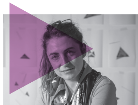
ZUHAR IRURETAGOIENA ABSENTIA. (TRIANGULO GORRIA, LERRO URDINA) ABSENTIA. (TRIANGULO ROJO, LINEA AZUL) SAN TELMO MUSEOA / MUSEO SAN TELMO