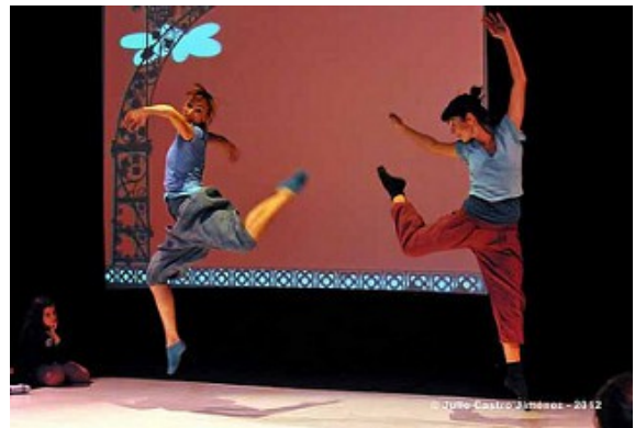
La lola balla