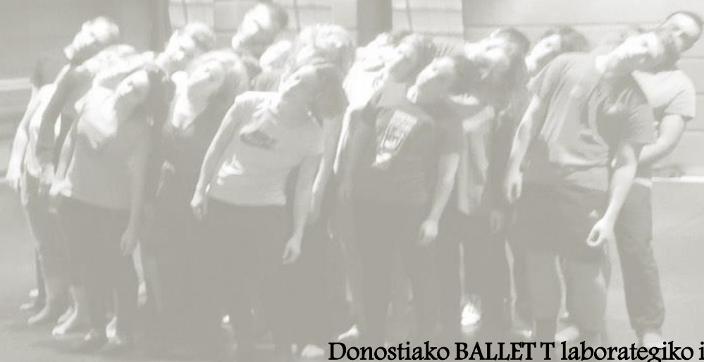
Donostiako BALLET T laborategiko ikasleak

Sormen prozesuan, Baionan zein Donostian TAILER koreografiko bana antolatu dugu. Tailer honen abiapuntutik, Bigarren urrats batean sakontzen joan eta ikuskizunerako hiru eszena antolatu dira ikasleekin.