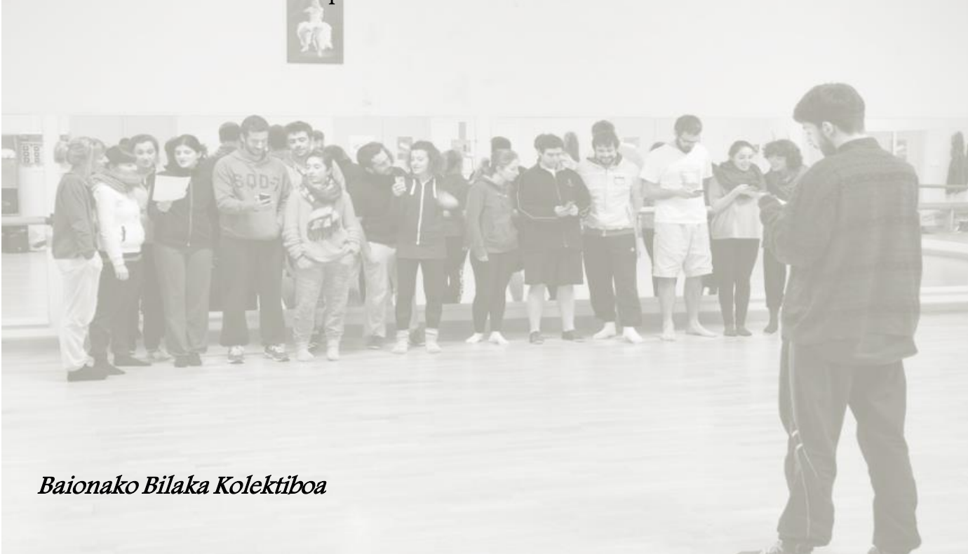
Baionako Bilaka Kolektiboa

Talde bakoitzean 20 herritarrek hartu dute parte, meta guztiak konpainiarekin batera ikuskizuneko estreinaldietan parte hartzeko aukera izan dute.