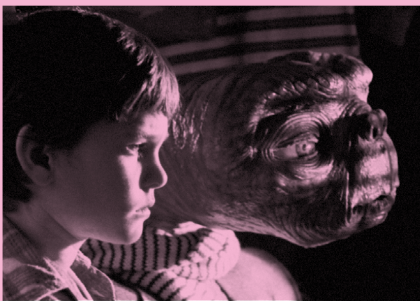
E.T. The Extra-Terrestrial , Steven Spielberg