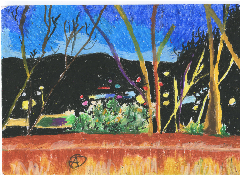
La tortuga en su río marca la hora. Ceras. A4. 2017

Haiku como motor que vincula mi subjetividad y los objetos con la realidad.