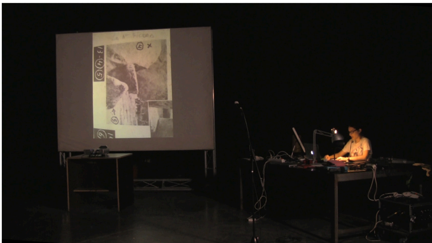
La primera piedra. Acción. 20 min. 2017

Muestro los videos con lecturas de mis textos, imágenes y canciones. Todo el material se surge a la vez que trabajo todo lo demás, son restos, que juntos cobran sentido. El tiempo y el ritmo de la conferencia es el elemento estructural que sustenta toda la acción. A veces varía, ya que voy añadiendo elementos o quitándolos dependiendo del momento del proceso en el que me encuentre.