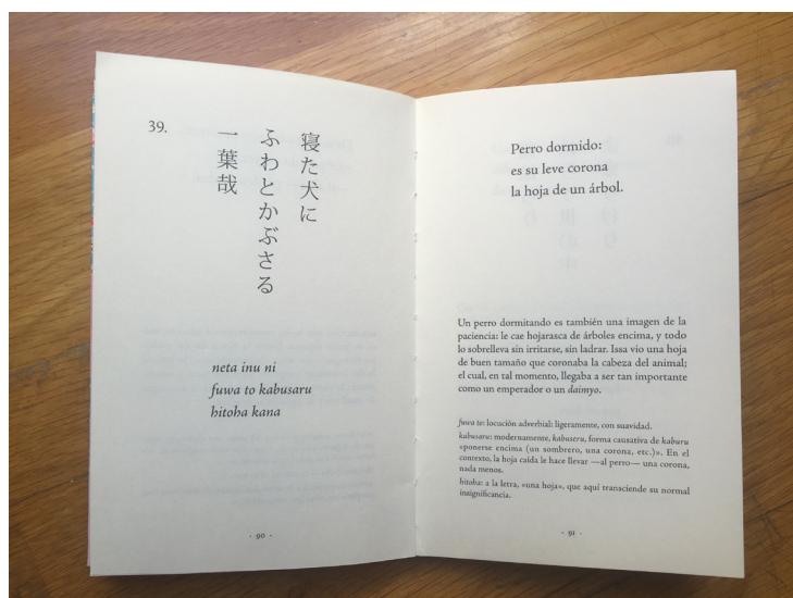
Fotografía del libro “ Mi nueva primavera ” de Kobayashi Issa. Uno de los libros con los que trabajo.

Utilizo el haiku como punto de partida para prácticas concretas, utilizándolo como excusa para dibujar, utilizándolo como título etc..., Al mismo tiempo, su condición esencial me ayuda a poner límite al ideal del que parto a priori.