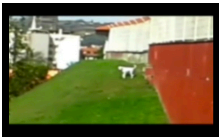
Frame del video correr que parte del haiku de Kobayashi Issa.