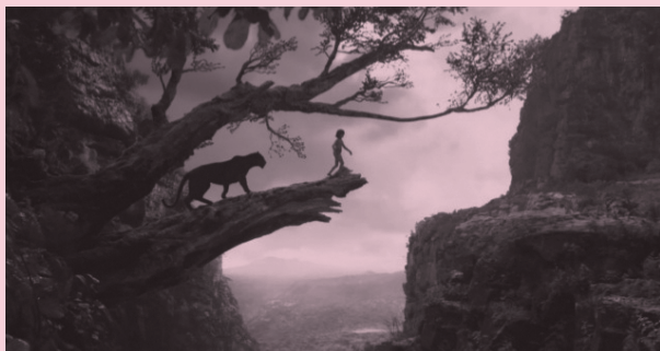
VFX munduari begirada 2019/06/22