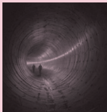
La ciudad oculta, Víctor Moreno 2019/06/01