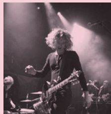
The Warly Jets + Indian Feathers 2019/06/07