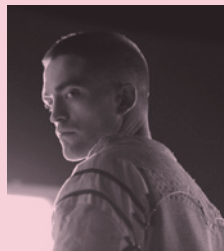
High Life, Claire Denis 2019/06/23

Claire Denis, Frantzia, 2018, 110' 📄 Sarrera / 📍 Zinea