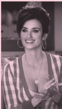
Volver, Pedro Almodóvar 2019/06/29