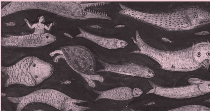
Gorputzaren bidez pentsatzea antzinaroan: Grezia, India eta Txina. 2019/06/05 > 07