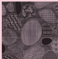
Shapereader korua 2019/06/06 > 2019/06/08