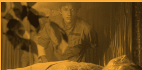
Invasion of the Body Snatchers (La invasión de los ultracuerpos), Philip Kaufman (13/09/2019)

19:00 Focos ZINEMALDIA 67 HOMENAJE PREMIOS DONOSTI MISSING Costa-Gavras, EUA, 1982, 122' 📄 Entrada / 📍 Cine