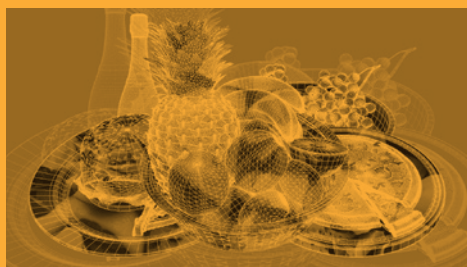
Seminario: El futuro de la gastronomía: nuevas tendencias en restauración (23/09/2019)

Inscripciones Aulas Kutxa Kultur (Septiembre 11 > 25)