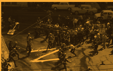
Z, Costa-Gavras (06/09/2019)