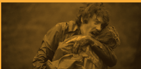
Don't Look Now (Amenaza en la sombra), Nicolas Roeg (07/09/2019)