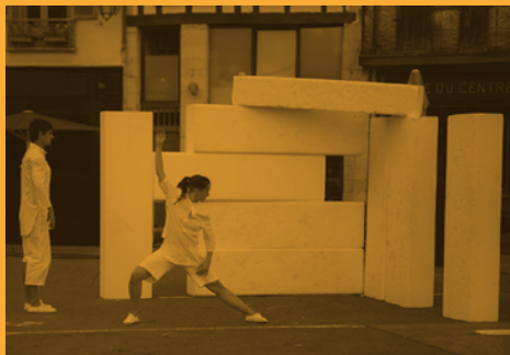
Danza contemporánea: LABO GO17 - Esku harriak: Oteizaren (h)aria (13/09/2019)