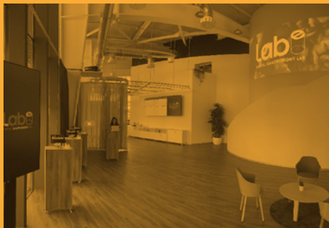
Puertas abiertas: LABe, Digital Gastronomy Lab (Todos los martes, : 18:00)

Festival de San Sebastián 67 edición. Sección Zabaltegi-Tabakalera (Sep.20 > 28)