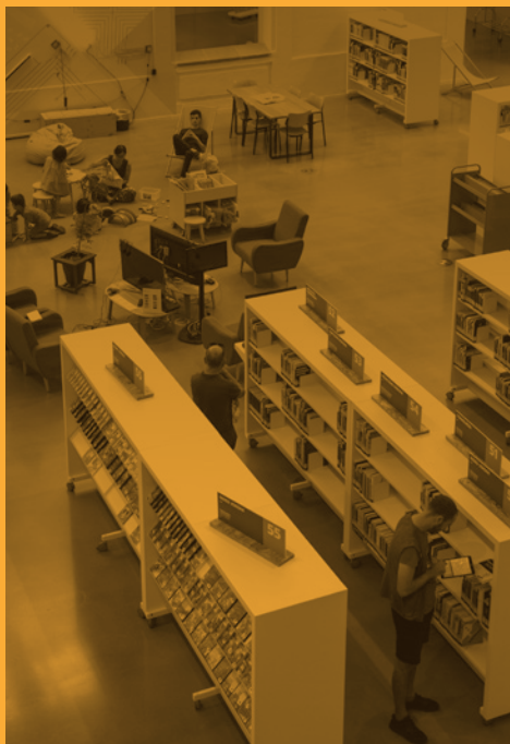
Arranca el curso en Ubik.