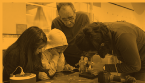
Do it in family VI, Hirikilabs (28/09/2019)