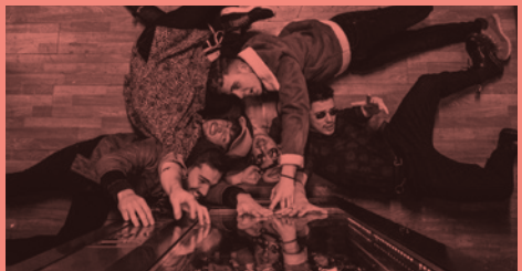
Special Trap Residence (2019/10/26)