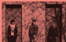
Soma Cult (2019/10/05)

19:00 Fokuak: ANGELA SCHANELEC SCHÖNE GELBE FARBE Angela Schanelec, Alemania, 1991, 5', 16mm. WEIT ENTFERNT Angela Schanelec, Alemania, 1991, 11', 16mm. PRAG, MÄRZ 92 Angela Schanelec, Alemania, 1992, 14', 16mm. ICH BIN DEN SOMMER ÜBER IN BERLIN GEBLIEBEN, (I STAYED IN BERLIN ALL SUMMER) Angela Schanelec, Alemania, 1994, 49', 35mm. 📄 Sarrera / 📍 Zinea