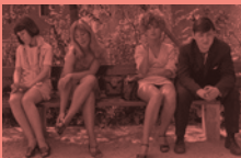
Katzelmacher, R. W. Fassbinder (2019/10/22)