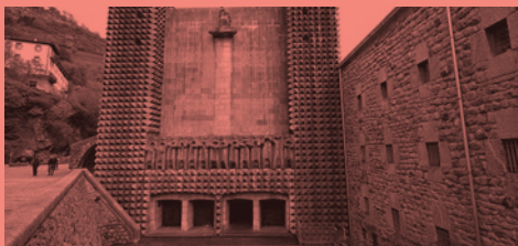
Oteiza en Arantzazu. Del debilitamiento de la expresión al espacio receptivo (2019/10/07)