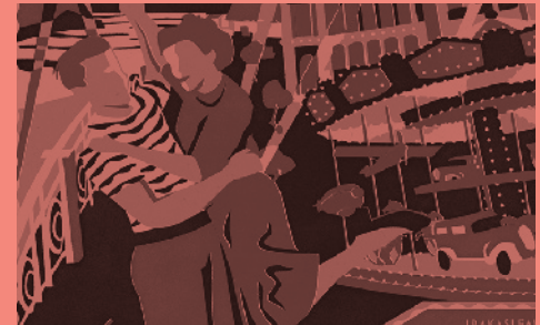
IV. Donosti Belle Swing Festibala (2019/10/31)