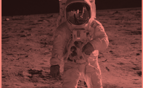
Apollo 11, Todd Miller (2019/10/31)