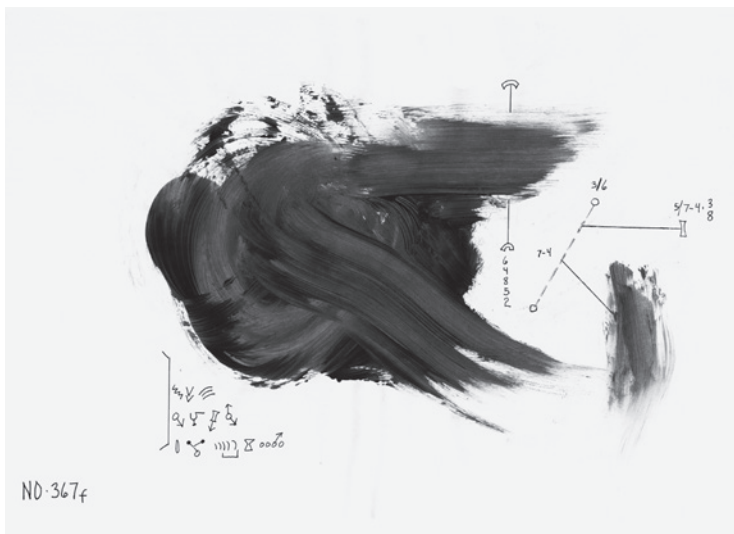
Anthony Braxton 367 F konposizio zenbakeriaren estraktua, 1967 © Anthony Braxton/ Tri-Centric Foundation

Artista batzuk partituren edo partituran oinarritutako obren bidez daude irudikatuta. Partiturak kontrolaren eta bat-batekotasunaren dialektikari aurre egin behar dion gizarte-programa irudikatzen du, eta hori aipatu dugun giza erantzunen aurrerapenaren erabilera menderatzailearekiko desberdina den modu batean egiten du. Notazio grafiko eta aleatorioarekin esperimentatu ondoren, Cornelius Cardew (1936-1981) eta The Scratch Orchestra bere taldea zuzenean politika utopikoarekin konektatzen saiatu ziren praktika musikalaren bidez. Luke Fowler rek (1978) atzera begirako entsegu egin du saiakera horri buruz Pilgrimage from Scattered Points izeneko filmarekin (2016). Anthony Braxton (1945) ere, azken 50 urteetako jazz-mitorik handiena, pieza musikalak, emanaldiak eta operak notatzen saiatu da modu ezberdinetan, aldi berean zehatza eta malgua izaten saiatzen. Eszeptikoagoa da Alex Mendizabalek (1961) For Orchestra -n proposatzen duen erabilera, ideiarik eta gogorik gabe idatzita dauden era guztietako ohar musikaletatik abiatuta eraikitzen den partitura bat. Mendizabalena ere, Famoseca (1987), 10 haize-instrumentistek kolunpiodun tiobibo batean jotzeko partitura bat da. Soinu-iturriak mugitzen ari dira eta azoka-testuinguru batean interpretatzen da, kontzertu-aretotik kanpo.