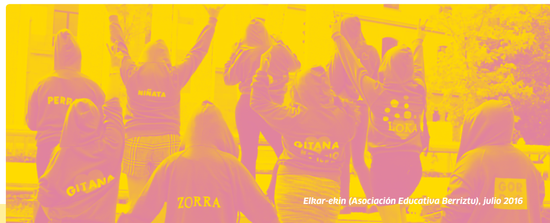
Elkar-ekin (Asociación Educativa Berritzu), julio 2016