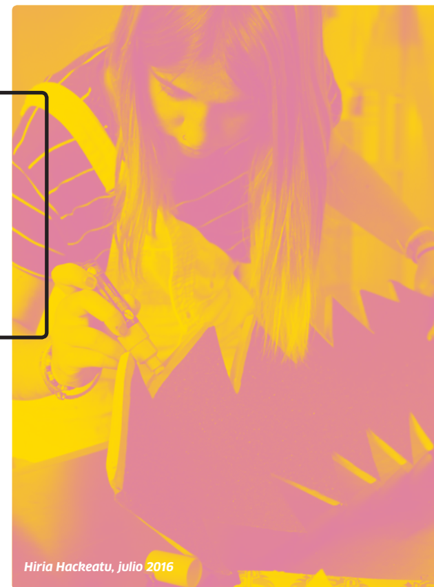
Hiria Hackeatu, julio 2016