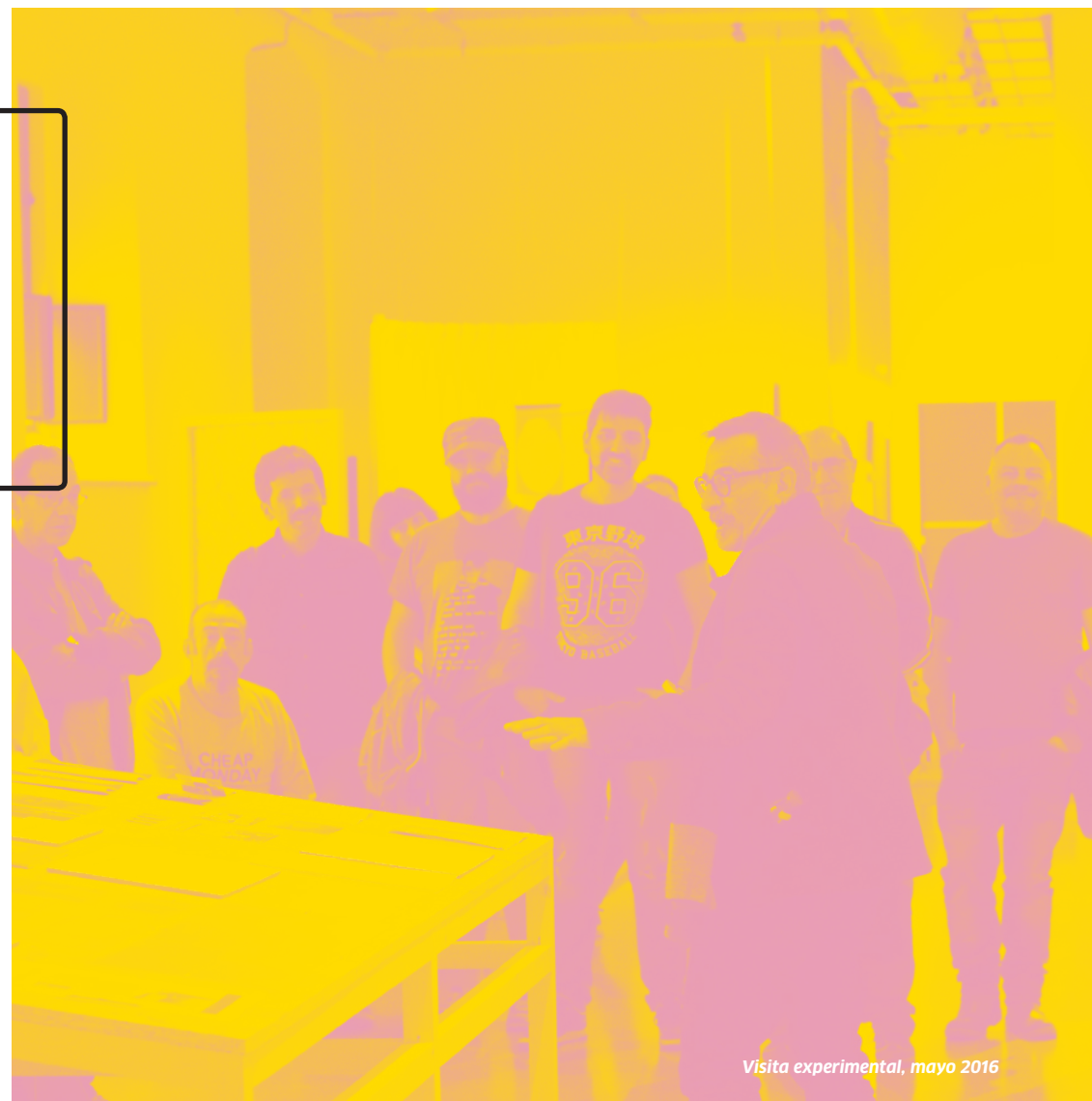
Visita experimental, mayo 2016