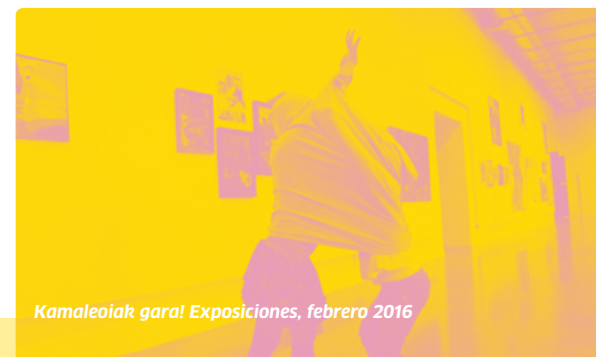
Kamaleoiak gara! Exposiciones, febrero 2016