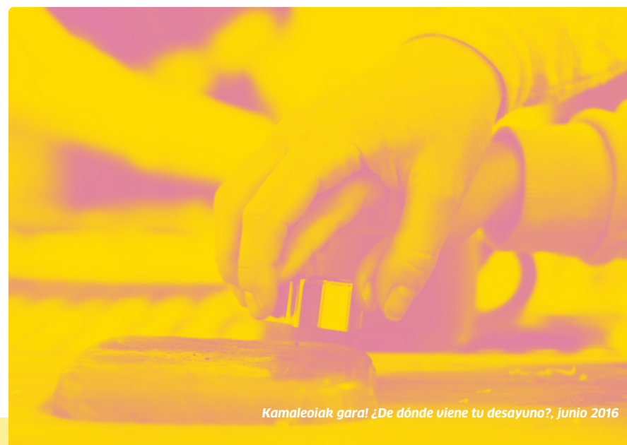
Kamaleoiak gara! ¿De dónde viene tu desayuno?, junio 2016