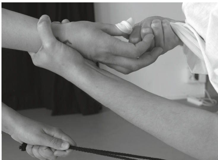
Eszter Katalin I Hold You and You Hold Me, 2019 Fotograma

Por último, Tabakalera quiere mostrar su agradecimiento a todos los artistas que participan en esta exposición. También a todos aquellos que a lo largo de estos cinco años han venido a trabajar y a compartir sus experiencias en el Espacio de Artistas, cuyas investigaciones y procesos han dejado su huella en este espacio. Sirva esta pequeña muestra para dejar abiertas las puertas de la creación contemporánea que está por venir.