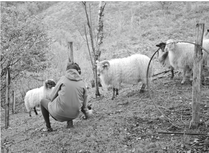
Agnès Pe Ardii Latx (1. fasea), 2020

Egoiliarrei egonaldian zehar eskaintzen zaien akonpainamendua erakundearen funtsezko zeregin bihurtu da. Alde horretatik, nabarmentzekoak dira Artisten Guneak sustatutako mintegiak eta topaketak, komisarioekin, kritikoekin, galeristekin edo erakunde publikoetako arduradunekin hitz egin eta eztabaidatzea helburu dutenak. Ate irekien jardunaldiek, studio visit direlakoez, aurkezpen publikoek edo tutoreek egiten dituzten akonpainamenduek ikuspegi berriak ematen dizkiete