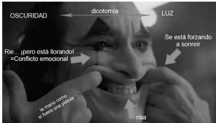
▲ Análisis del film Joker