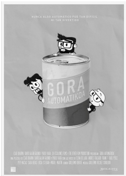
▲ Cartel de la película Gora Automatikoia