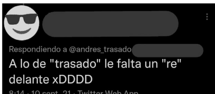
▲ Respuesta crítica de un fan