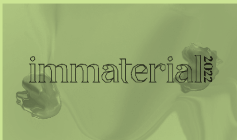
Encuentro Immaterial 2022 (01-02/04/2022)