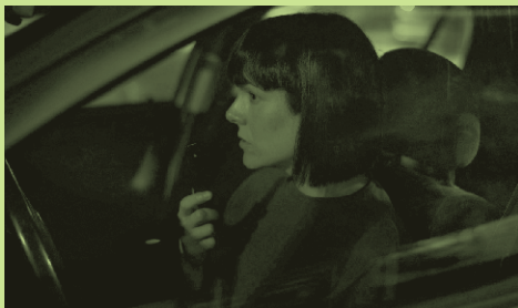
918 gau (03/04/2022)