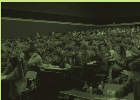
Le concours (16/04/2022)