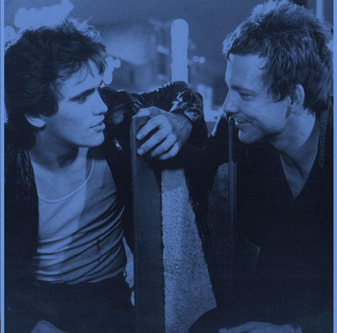
Rumble Fish/La ley de la calle (04/05/2022)