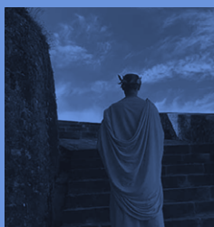
Yo, Claudio (06/05/2022)