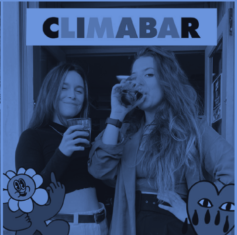
Activistas digitales medioambientales. Climabar. (26/05/2022)