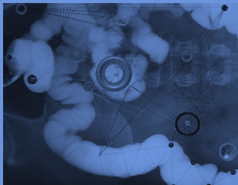
Atlas. Fotografías intervenidas (18/05/2022)