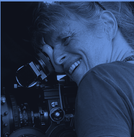
Claire Simon. Masterclass (2022/05/28)