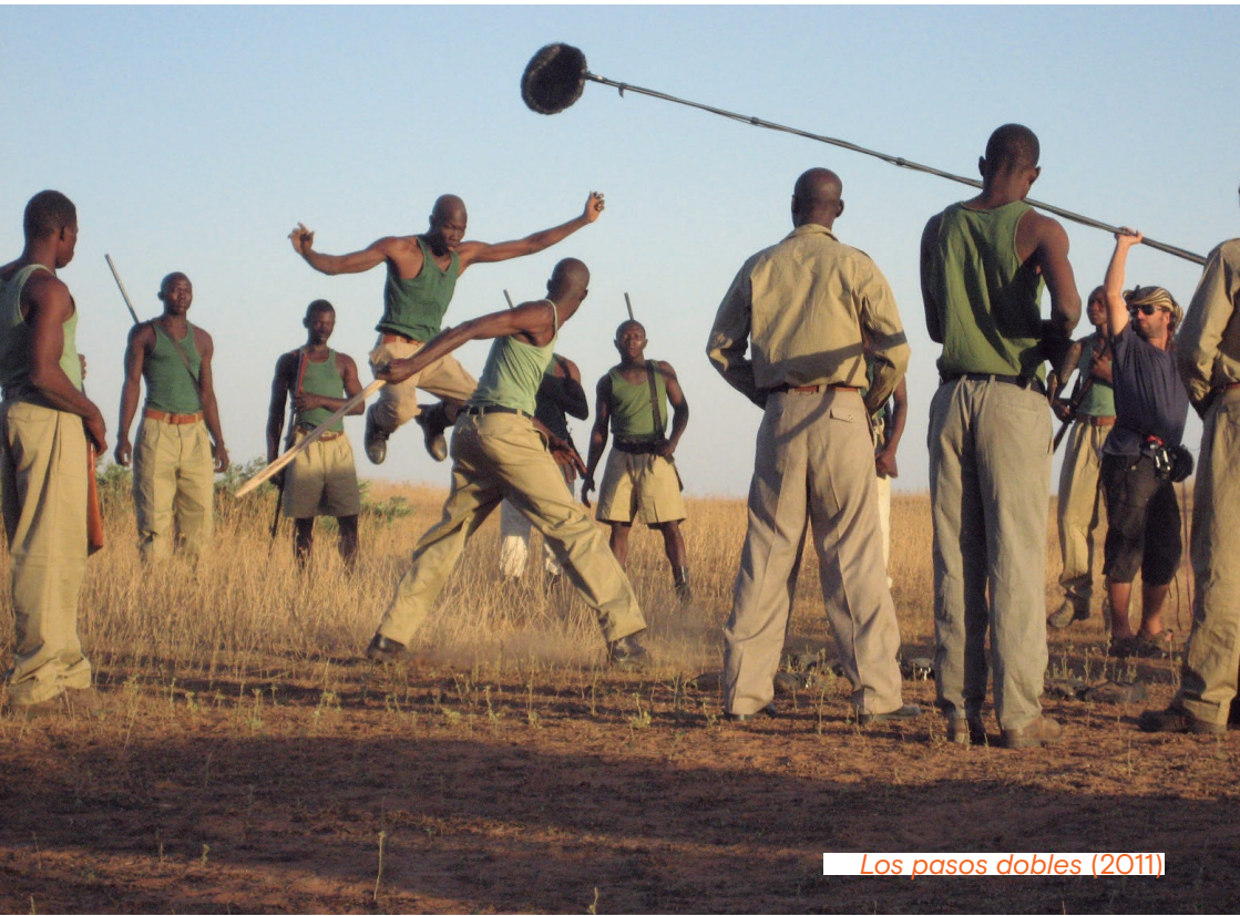
Los pasos dobles (2011)