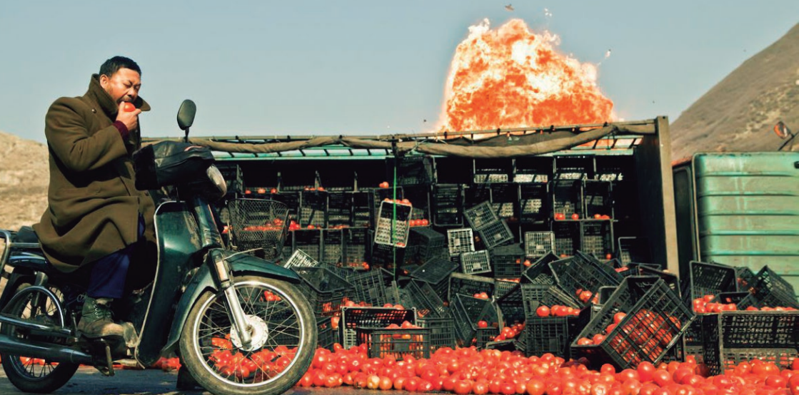
A Touch of Sin (2013)