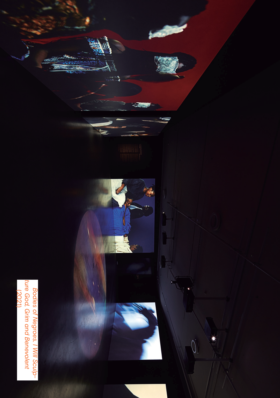
Bodies of Negroes: I Will Sculpt- ture God, Grim and Benevolent (2021)