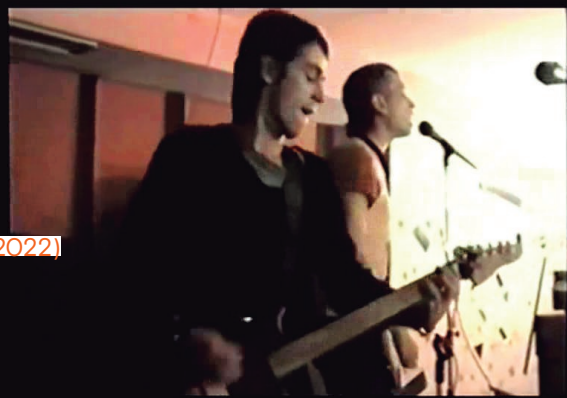
Prohibimos en España (2022)