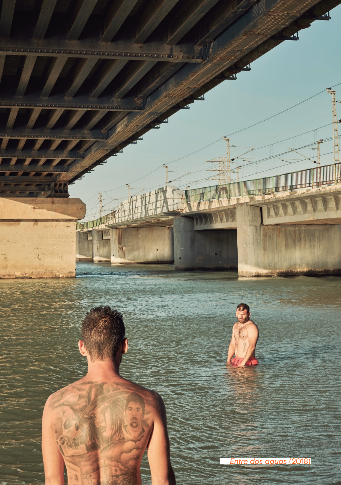
Entre dos aguas (2018)