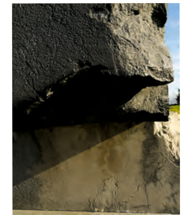
Agíña (Frisoa seriea) , 2021 5 argazki 100 x 70 cm bakoitza Producción: Banco Sabadell / Artingenium Exposición Museo Oteiza