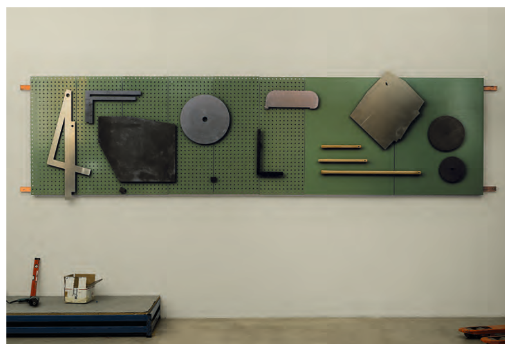
Frisoa , 2022 Altzairua, aluminioa eta egurra 470 x 130 x 14 cm Banco Sabadell / Artingenium-ek ekoiztua Erakusketa Tabakalera eta Oteiza Museoen