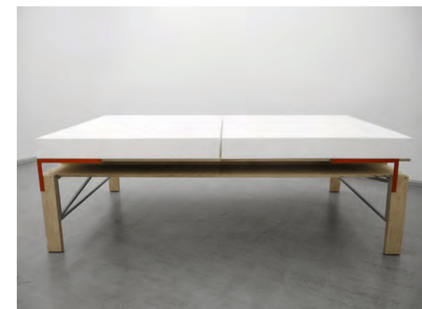
Izenbururik gabe (pin pon) , 2022 Poliestirenoa, metala eta egurra 274 x 162,5 x 91,25 cm Banco Sabadell / Artingenium-ek ekoiztua Erakusketa Tabakalera