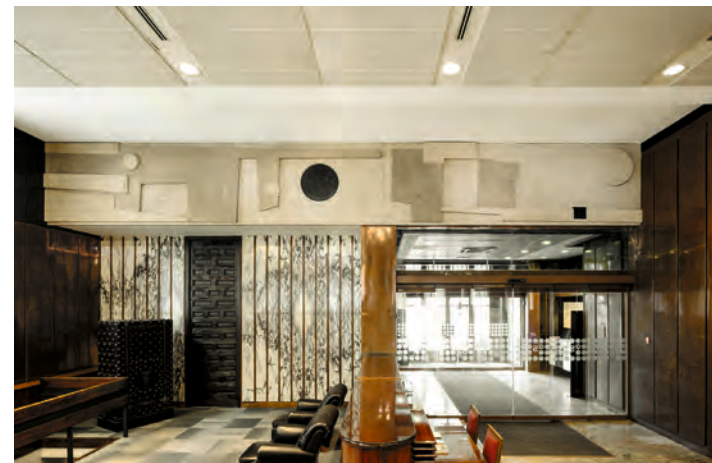
Jorge Oteiza. Aita Donostiaren omenez , 1959 Hainbat harri motatan egindako tallia. 140 x 900 cm Banco Sabadell Arte Bilduma, Donostia Jorge Oteiza © Pilar Oteiza, 2022