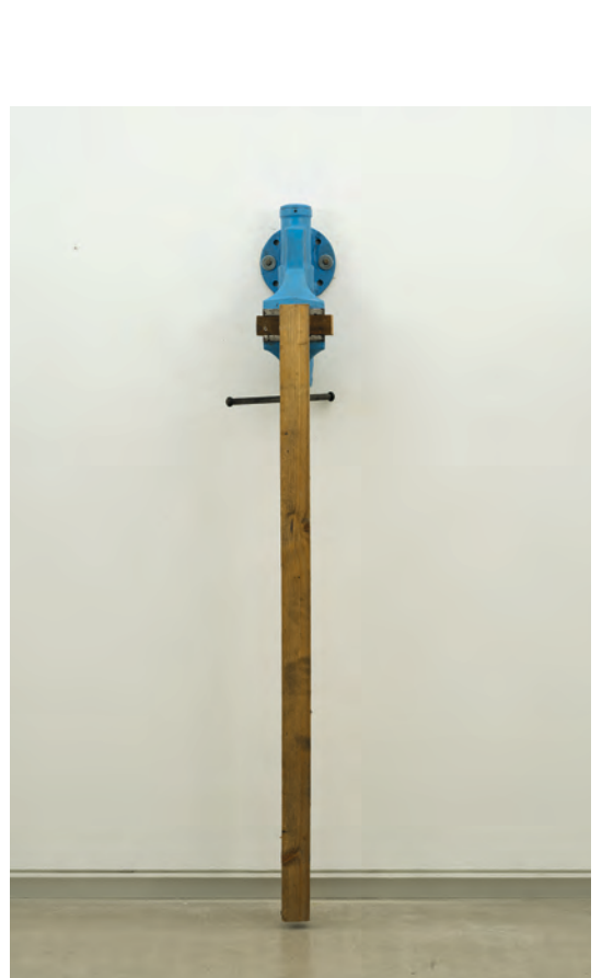
Izenbururik gabe (Frisoa seriea) , 2022 Altzairua eta egurra 170 x 50 x 25 cm Erakusketa Tabakalera eta Oteiza Museoen