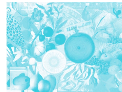
BIHARKO OGIA, MIÉRCOLES 15