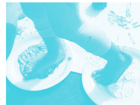
ITSASPEKO GORRIA, MARTES 07