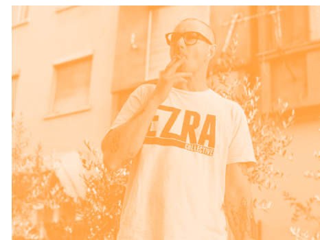
DIVORCE FROM NEW YORK, VIERNES 03