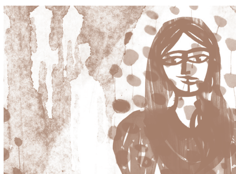
→ 07 de Enero El sueño de la sultana Sala de exposiciones 2 - 1ª planta