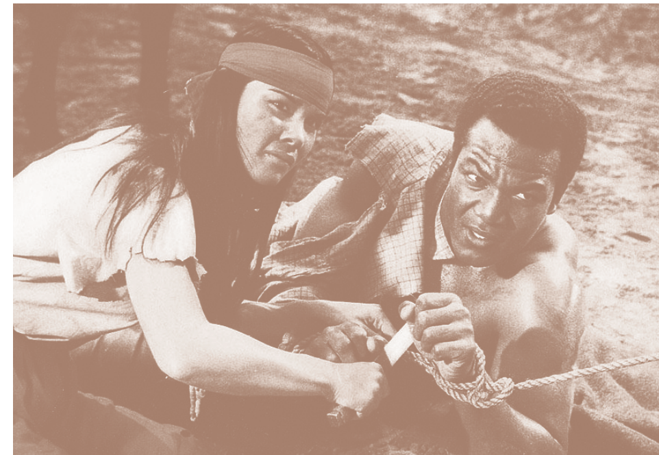
RÍO CONCHOS, MIÉRCOLES 31