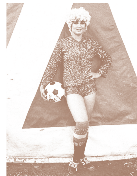
→ 25 de Febrero Isabel Azkarate Kutxa Kultur Artegunea - Planta 0