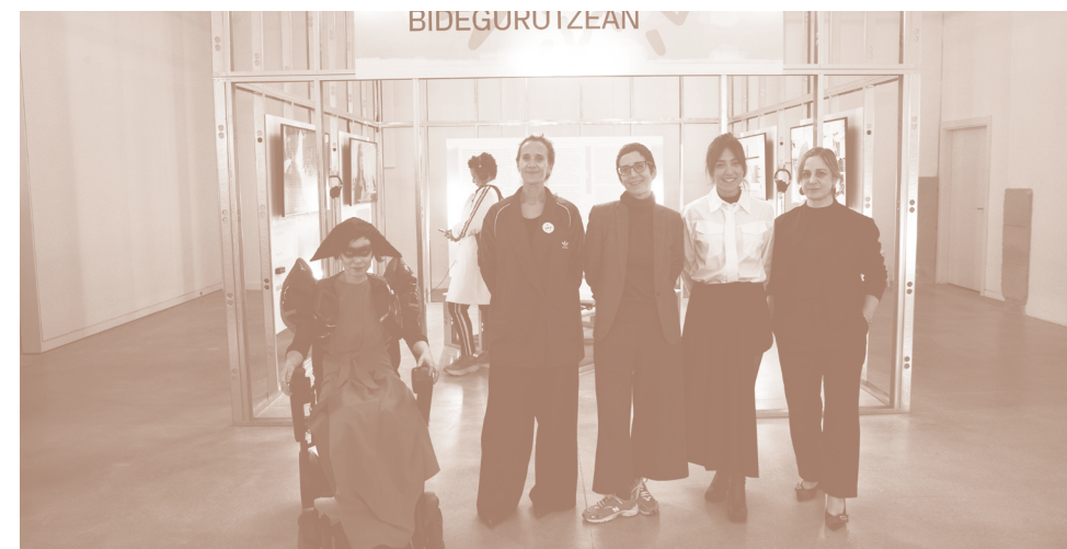
MÁQUINAS DE INGENIO. JAKINTZEN BIDEGURUTZEAN. ENCUENTRO MIÉRCOLES 17