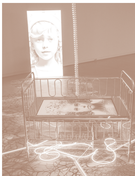
→ 04 de Febrero Máquinas de Ingenio. Jakintzen Bidegurutzan Sala de exposiciones 1 - 1ª planta