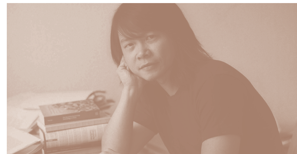
TECNODIVERSIDAD: MÁQUINAS Y SENSIBILIDAD, YUK HUI, JUEVES 25