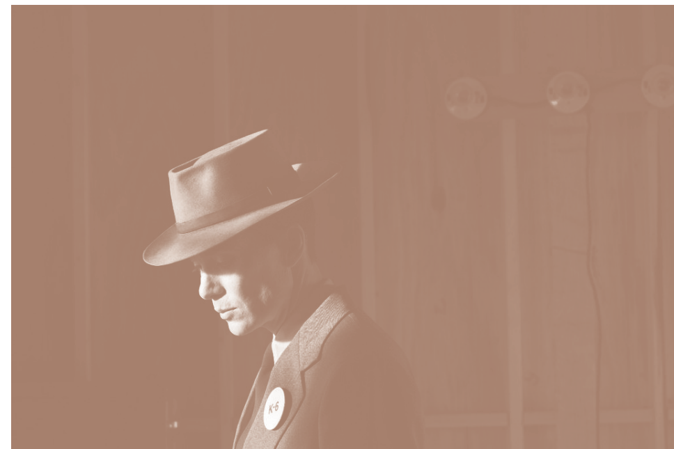
OPPENHEIMER, JUEVES 11

19:00-21:00 VO EN, Sub. ES RÍO CONCHOS Gordon Douglas, EUA, 1964 107' Entrada Cine