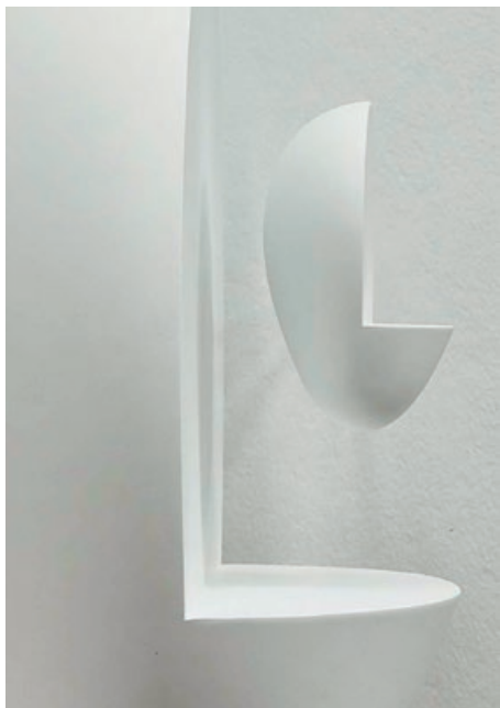
Iman Issa Self-Portrait (Self as William S. Burroughs) , 2019

ikusgarritasuna eta ikusezina banantzen dituzten material bigunetan inspiratuek larru bihurtzen dute beren izurra: hormigoizko olanek, toallek eta errefortzu-barrek eszena bat osatzen dute. Etzanik edo tente, frikzioa sortzen dute, pultsio bat KAIA 3 eta Erdibitu artean: erditze bat, irudi bat hedatzen da, zer gertatu ote da haien artean? Kontaktuz blaituta landutako egitura zehatz hauek interdependentek dira, elkarren beharra dute, eta horrela eusten diote elkarri.