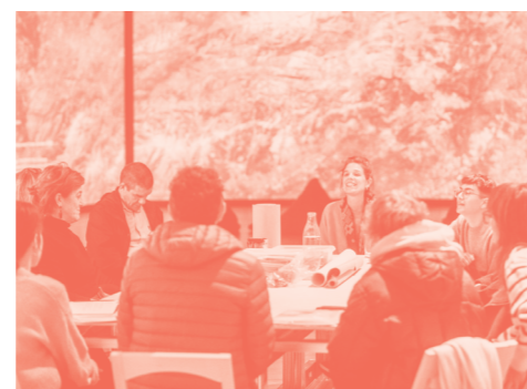
ARTE MAKINA. LARRUAK ETA IZURRAK. JUEVES 08