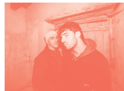
DUPLA + AWAKATE. SÁBADO 23

CONOCE TABAKALERA Inscripción Punto de información