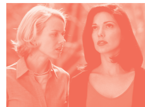
MULHOLLAND DRIVE. JUEVES 21