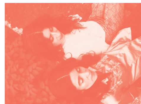
AMORANTE + MUARE. SÁBADO 02