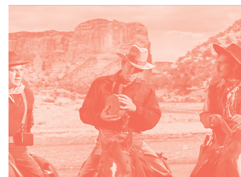
MACKENNA'S GOLD, MIÉRCOLES 27