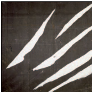
Untitled (Treatise on Melancholia) , 1989 Olioa, igeltsua olana iragazgaitzean Artistaren bilduma