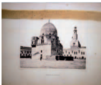
Flaubert's Letters to His Mother , 2005 Tinta poliesterrean Artistaren bilduma