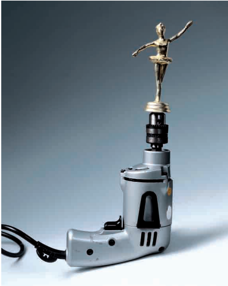
Priscilla Monge Bailarina, 1995.