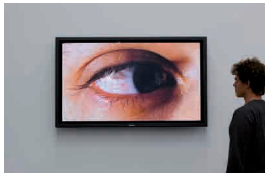
Rafael Lozano-Hemmer - Tensión superficial , 1991-2004.