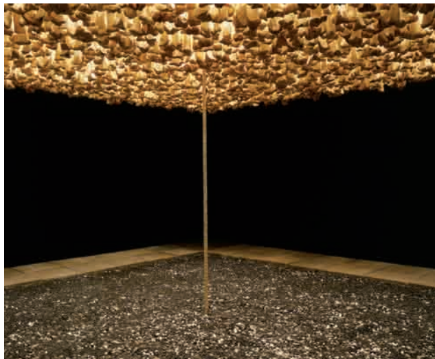
Cildo Meireles Missão / Missões (Como construir catedrais), 1987.

Cildo Meireles, Valeska Soares eta Ernesto Neto, Brasilgo artista garrantzitsuenen artean daude eta beren lan esanguratsuenetakoak ikusgai ditugu Tabakaleran. Erakusketaren osotasunean paper nagusia jokatzaren hiru instalazio handi dira, ikuslea lanetan parte hartzera edo artelanaren zati bilakatzera gonbidatzen dutenak.