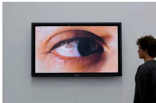
Rafael Lozano-Hemmer - Tensión superficial , 1991-2004.