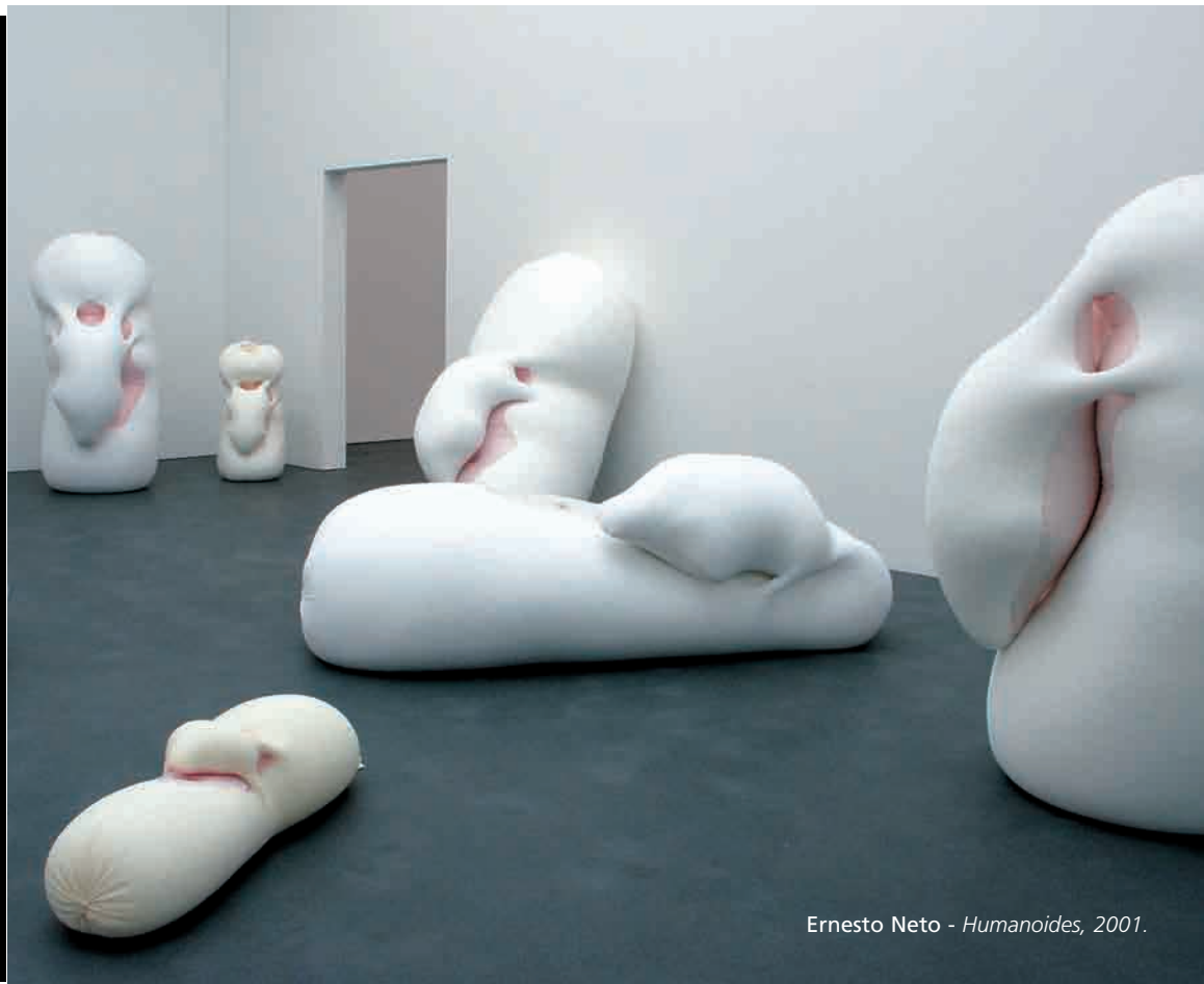
Ernesto Neto - Humanoides , 2001.