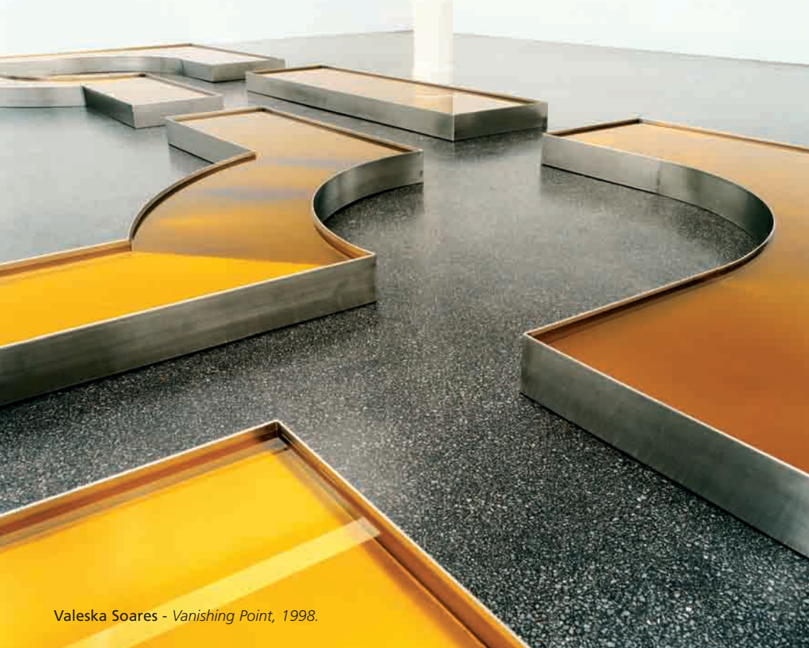
Valeska Soares - Vanishing Point , 1998.