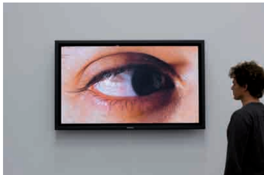
Rafael Lozano-Hemmer - Tensión superficial , 1991-2004.