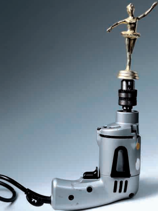
Priscilla Monge Bailarina, 1995.