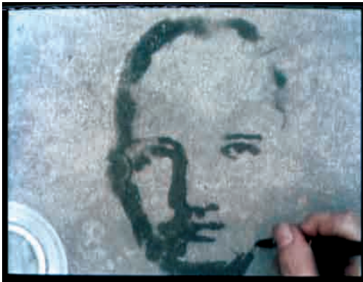
Óscar Muñoz - Re / trato , 2003.