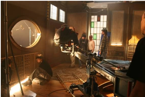
Rodaje del cortometraje Cotton Candy

Los fotógrafos de la Sociedad Fotográfica de Gipuzkoa tendrán la ocasión de recorrer el edificio para fotografiar sus espacios, también se realizará una convocatoria para animar a los vecinos de Egia a fotografiar los diversos rincones del barrio. Estos trabajos serán presentados en el curso de la exposición, en la sala de cine de Tabakalera.