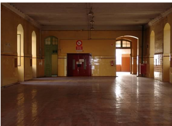
Galerías de Tabakalera

Además el público general también tendrá la oportunidad de visitar la antigua fábrica de tabacos en las visitas guiadas que se realizaran todos los fines de semana, con la colaboración de Kutxa.