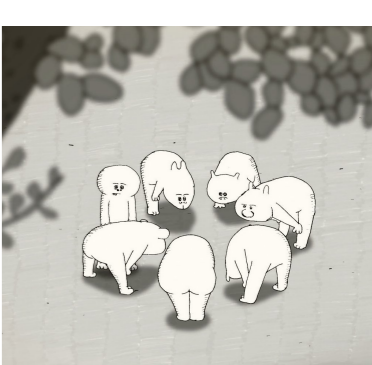
It's Time for Supper