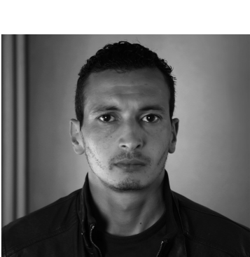
Le Jour a vaincu la nuit

LABO 2014 + Kimuak 2013 17 – 21 febrero 19:30 Teatro Principal Entrada: 2 euros