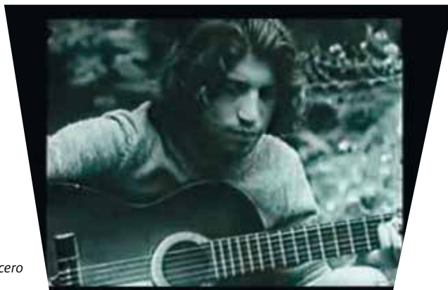
Gitanos sin romancero

Erakusten ditugun hiru dokumentalek – Gitanos sin romancero , 1976, Llorenç Soler; Bellvitge! Bellvitge! , 1979, Julián Álvarez; La ciudad es nuestra , 1974, Tino Calabuig eta Miguel Ángel Condor– atzera begirako begirada hori eskaintzen dute. Izan ijito, andaluziar edo mertxeroentzako, garapen tardofrankistako arkitektura asistentzialeko proposamen habitazionalak, erresistentzietekin eta komunitate-modu berritzaileekin egiten zuten aurre, eta horiek instituzionalizatzea kostatzen zitzairen. Hiru filmak oso kritikoak dira erregimenarekin – gure orainaldirako oihartzun asko dituen kapitalismo autoritarioa- eta flamenkoa erabiltzen dute -ez soilik musika, baizik eta flamenkoa "ekintza sozial oso" moduan- zentzu zabalean: alde batetik, protesta politikorako adierazpen gisa; eta bestetik, honakoa ahalbidetzen duen sisteman erabiltzen dute: jatorrizko komunitateekin loturei eusten diena eta aldi berean egokitzeko eta bizitzea egokitu zaien espazio berria bizigarri egiten duen sistema.