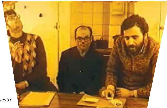
La ciudad es nuestra

Los tres documentales que mostramos – Gitanos sin romancero , 1976, de Llorenç Soler; Bellvitge! Bellvitge! , 1979, de Julián Álvarez; La ciudad es nuestra , 1974, de Tino Calabuig y Miguel Ángel Condor– abundan en esa mirada retrospectiva. Sean para gitanos, andaluces o mercheros, las propuestas habitacionales de la arquitectura asistencial durante el desarrollismo tardofranquista se enfrentaban con resistencias y formas de comunidad novedosas que les costaba institucionalizar. Los tres films son muy críticos con el régimen –un capitalismo autoritario con muchos ecos para nuestro presente– y utilizan el flamenco –no solo la música sino el flamenco como "hecho social total"– en un amplio sentido: por un lado, como expresión de protesta profundamente política; por otro, en un sistema que permite, a la vez, mantener lazos con las comunidades de procedencia y recombinarse para adaptarse y hacer habitable el nuevo espacio en que les ha tocado vivir.