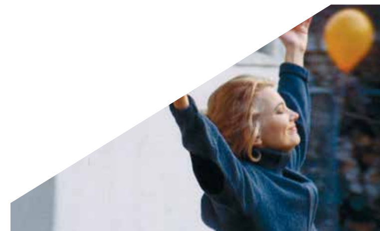
Una mujer bajo la influencia