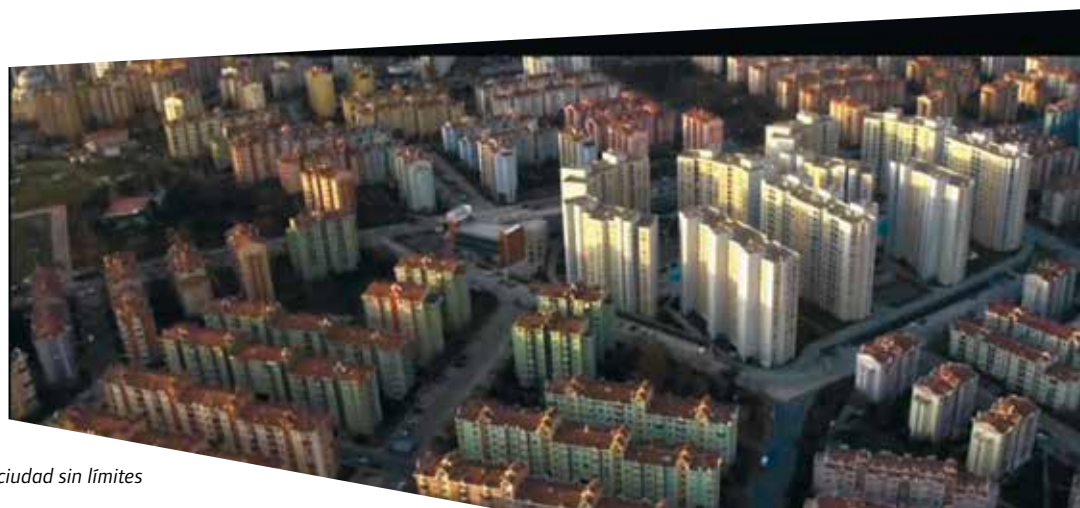
Ekümenopolis: una ciudad sin límites

Gure apostua ez da irudikari berri bat sortzea, gure amets-errepertorioa berriztuko duen abangoardia berri bati laguntza eskatzea. Guk desio duguna "badela" sinetsita egonik, hiri-botereentzako problematikoa- goak diren eszenatoki eta erritualak arakatzearan alde egiten dugu, desagertu nahi ez duten iraganeko hondakinak, ohiturarik desatseginenak, udaletxeak ezabatu nahiko lukeen latsa metropolitanoa arakatzearan alde egiten dugu.