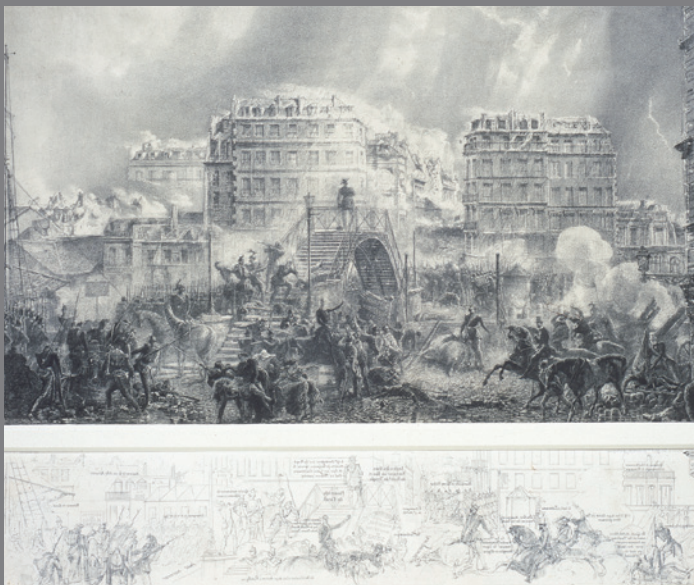
Igmann François Bonhommé, Prise de la barricade du Petit Pont (1848). Saint Denis-eko arte eta historiako museoa. Film negatiboa: I; Andréani.