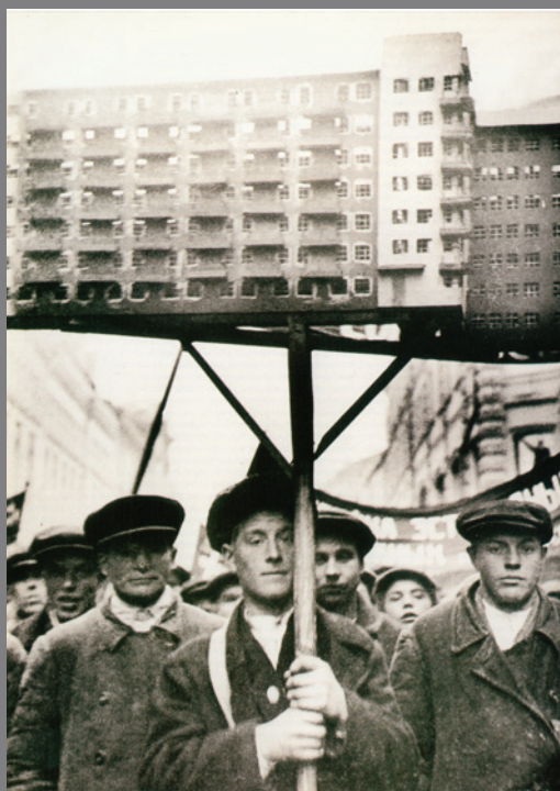
Sobietar Batasuneko eraikuntzako langileak pertika batean muntatutako etxebizitza eredu berrien unitate modernistekin desfilatzen. 1931.