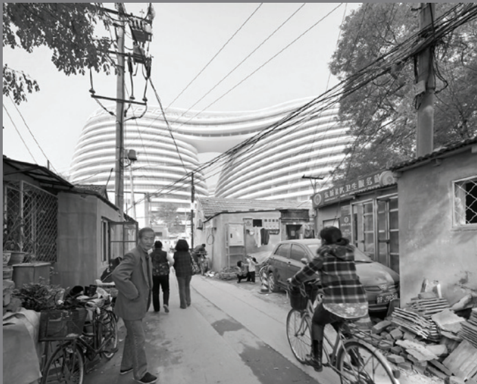
Galaxy Soho. Beijing. Argazkia: Hufton+Crow, Zaha Hadid Architects.