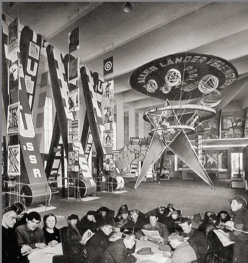
El Lissitzky. Entrance of the USSR pavilion. Pressa azoka, Kolonia. 1928.