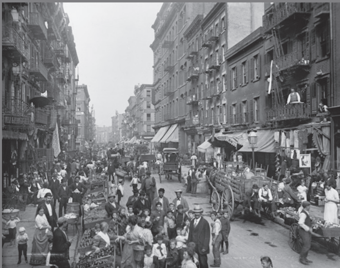
New York-eko Mulberry kalea, 1900.