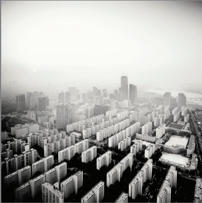
Yeouido at Dusk, Seul, Hego Korea, 2011. Martin Stavors.