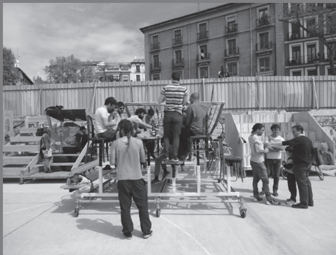
Garagar soroa, Madrid.

hegemonia ezartzeko akordiorik ez dagoenean, gobernantzaren benetako aurpegia dela orduan udal-ordenantza. Neure buruari galdetzen diot parte-hartzea benetan eraginkorra den edo hiriko espazioa demokratikoki eraikitzeko benetako aukerak burutik kentzeko gailu bat besterik ez den».