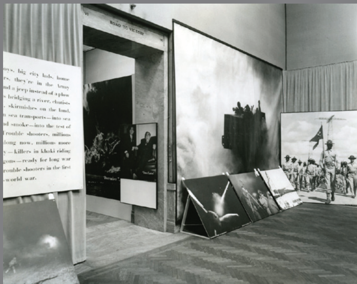
Road to Victory, Herbert Bayer Bauhaus-eko diseinatzaileak Chicagoko arte institutuan komisariatua. 1943.