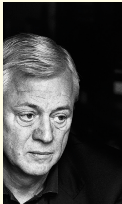
Alexander Kluge en la producción televisiva