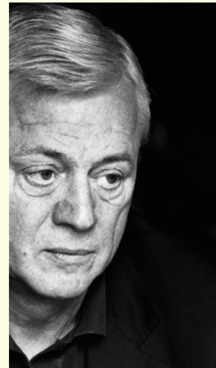
Alexander Kluge telebistako ekoizpenean