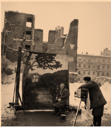
Hiria eta bestelako politikak