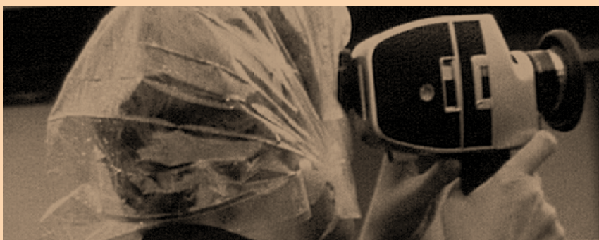
Zinema anonimoaren historiak (estetiko eta politikoak)

SUPRASENSORIAL VS SUBSENSORIAL. BIGARREN SINODO PSIKODELIKOA SUPRASENSORIAL VS SUBSENSORIAL. EL SEGUNDO SÍNODO PSICODÉLICO SUPRASENSORIAL VS SUBSENSORIAL. THE SECOND PSYCHEDELIC SYNOD LUMAK/ LAS PLUMAS / FEATHERS Ion Munduate 📍 Ganbara / Desván / Loft