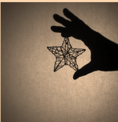
MANS, Fes-t'ho com Vulguis